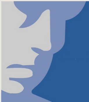
DR.IGNACIO DIAZ ILLAS