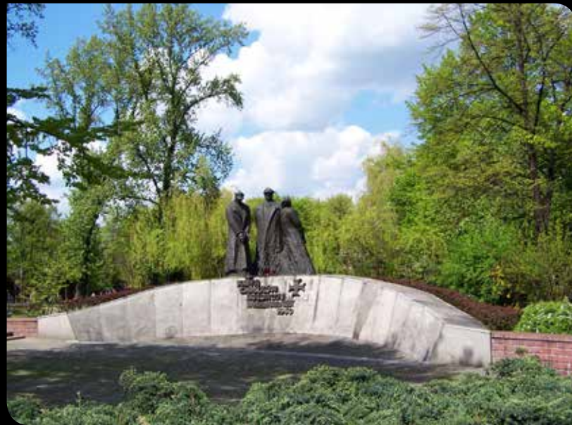
El monumento de las Víctimas de Katyń en Katowice

La masacre del bosque de Katyń es el nombre por el que se conoce a los asesinatos en masa de oficiales del ejército, policías, intelectuales y otros civiles polacos llevada a cabo por la policía secreta soviética en abril de 1940, tras la invasión de Polonia al inicio de la Segunda Guerra Mundial. Se estima que las víctimas fueron al menos 21768 ciudadanos polacos. Del total de muertos, cerca de ocho mil eran militares prisioneros de guerra, seis mil eran policías y el resto eran civiles integrantes de la intelectualidad polaca, profesores, artistas, investigadores e historiadores presos bajo la acusación de ser saboteadores, espías, terratenientes, dueños de fábricas, abogados, funcionarios públicos peligrosos y sacerdotes cristianos. Las fosas comunes fueron cubiertas con lápidas simbólicas