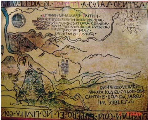
MAPA DE LA CIUDAD DE PAITITI