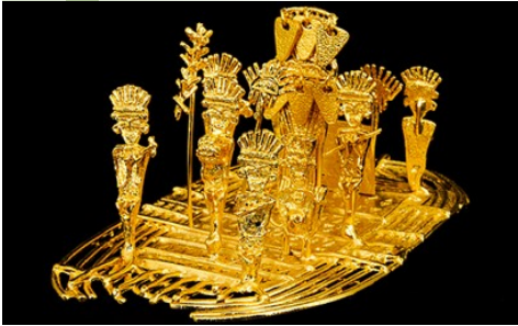
LA Balsa MUISCA