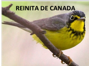
REINITA DE CANADA

En el Día Mundial de las Aves Migratorias, en Venezuela, 155 especies de aves se posan temporalmente. La mayor parte de los turistas emplumados llega desde Norteamérica, siguiendo el reloj biológico y ambiental que las impulsa a buscar mejores temperaturas; de ese total, 135 vienen de Norteamérica y 20 del Hemisferio Sur. ( Águila pescadora, chorlo real, tierra canalera, gaviota patinegra, cuclillo pico amarillo, atrapamoscas boreal, atrapamoscas de la selva; pitirre gris, golondrina de horquilla, paraulata cachetona, canario de mangle, reinita de Connecticut, Tigüi tigüi chico: Tringa flavipes (ártico), Reinita de Canadá (Cardellina canadensis), playero Semipalmado (Charadrius semipalmatus), pato canadiense. entre muchas otras especies).