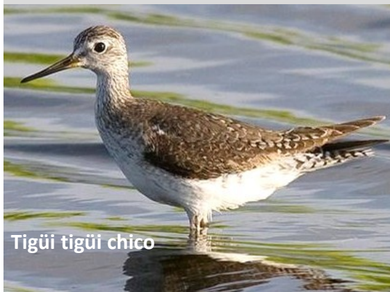
Tigüi tigüi chico