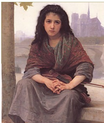
William Adolphe Bouguereau